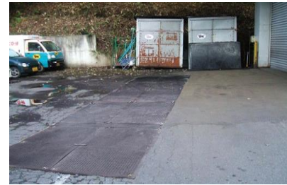
アスファルト吸水防止