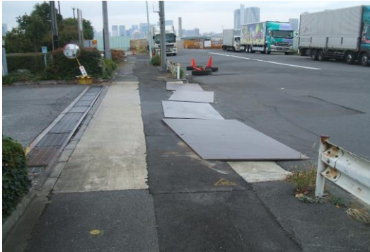
工事現場出入口 敷鉄板鉄板風景 (路面抵抗が小さく滑ります。)