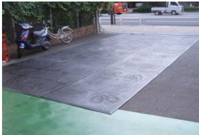
トラックタイヤ音消音