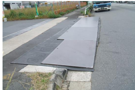
敷鉄板固定 消音 90dBA⇒60dBA (P.PANELすべり抵抗 \mu=1 鉄板の約2倍)