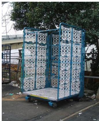
ロールボックスパレット ナイロン車輪 消音